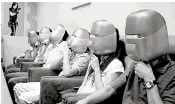
“杀人游戏”在白领中很流行。